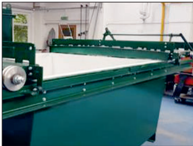
A tolóajtó nyitott állapotban a teljes szélesség eléréséhez töltésnél.